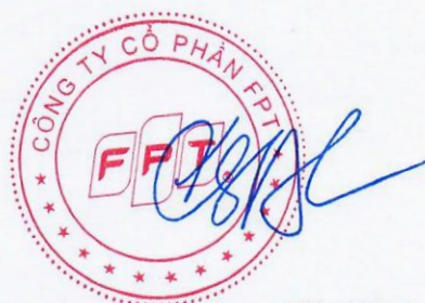
Trương Gia Bình